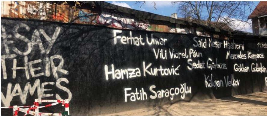
say their names (Hanau, Metzgerstraße)