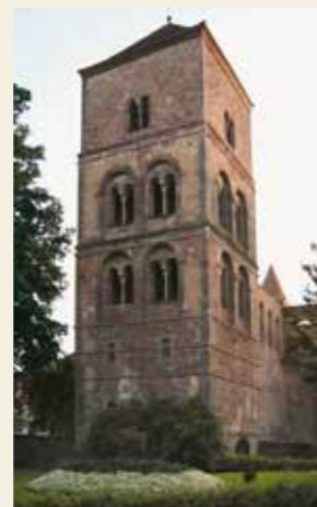
Die Stiftsruine in Bad Hersfeld