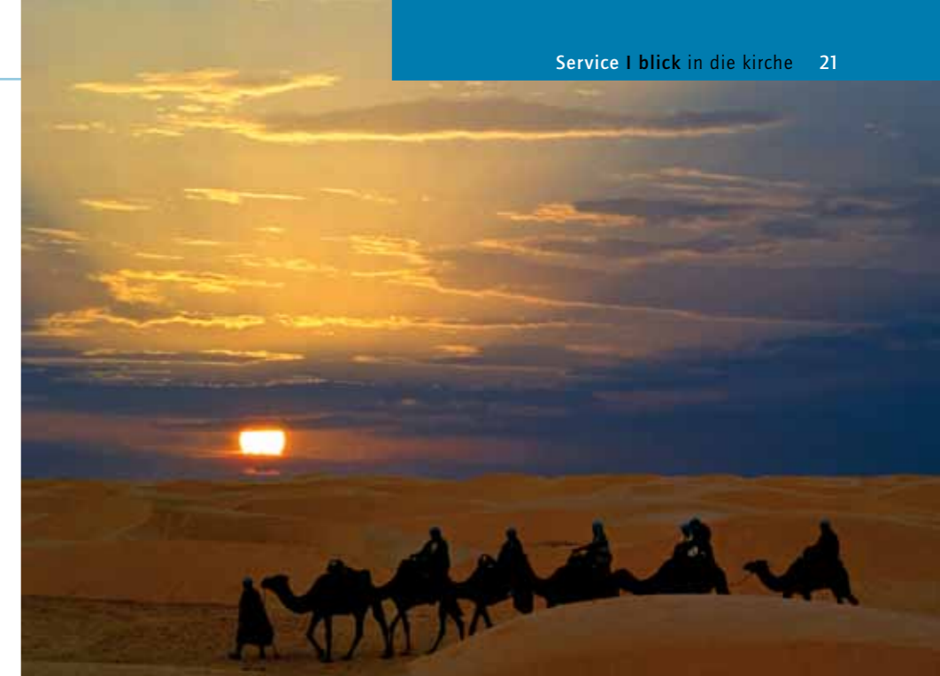
Wie ist man früher durch die Wüste gereist? Wie hat man in Zelten gelebt? Was hat man gegessen? Die FBS Marburg begibt sich auf die Spuren von Josef und seinen Brüdern ► Tagungen, 18.4.

So 15.30–17.30 Uhr, Lutherischer Kirchhof 3, Mehrgenerationenhaus, Seminarraum.