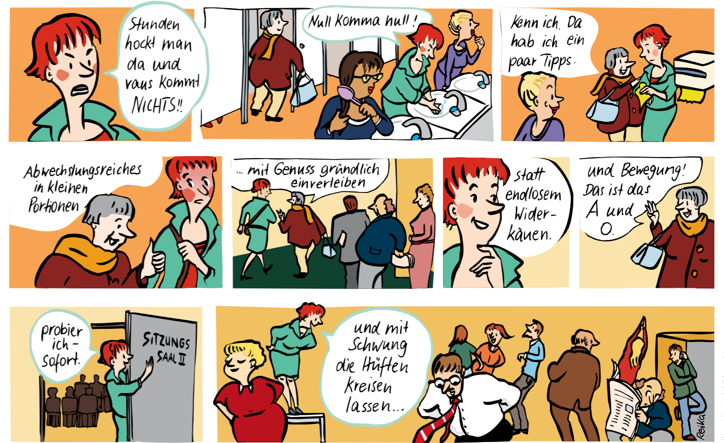
Wie aus einem gründlichen Missverständnis eine peppige Anregung werden kann, das hat sich unsere Illustratorin Reinhild Kassing ausgemalt.

Es genügt, das Stichwort „Sitzungen optimieren“ bei Google einzugeben, und schon eröffnet sich ein Tableau an Vorschlägen, Tipps und Tricks für eine gute, erfolgreiche und angenehme Sitzungskultur. Viele dieser Regeln und Ratschläge sind nicht neu. Zu lang, zu unstrukturiert, ohne sachliche Notwendigkeit einberufen, zu magere Resultate – all das muss nicht sein. Für das Gelingen einer Sit-