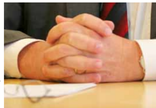
KV-Sitzungen „sollen mit Gebet eröffnet und geschlossen werden“, heißt es in der Grundordnung der EKKW in Artikel 29

Allerdings habe man aufgrund des rückläufigen Zinsniveaus die Zahl der geförderten Projekte von anfangs noch 26 auf nunmehr zwölf pro Jahr reduzieren müssen, sagte Fehr. „Die Stiftung ist dringend auf Zustiftungen angewiesen.“ Zum wiederholten Mal habe man auf die Zinsen des kommenden Jahres vorgreifen müssen, da sonst das Geld nicht gereicht hätte.