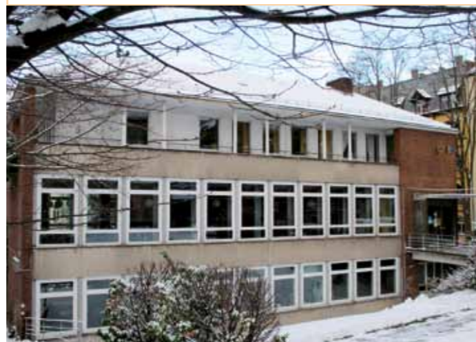
Chor und Turm der 1908 erbauten Friedenskirche (ganz links), das 1959/60 errichtete Gemeindehaus (links)