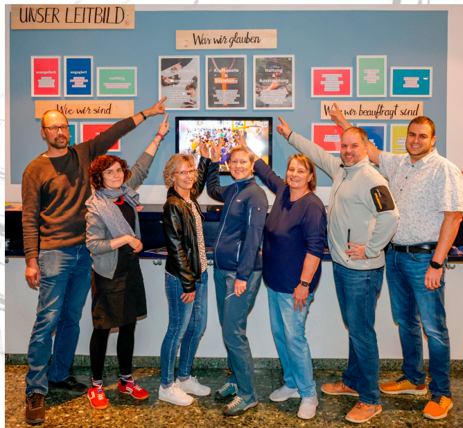
Projektgruppe Leitbildprozess, Oberkaufungen.